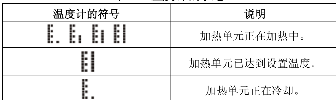
表 2 温度计的状态